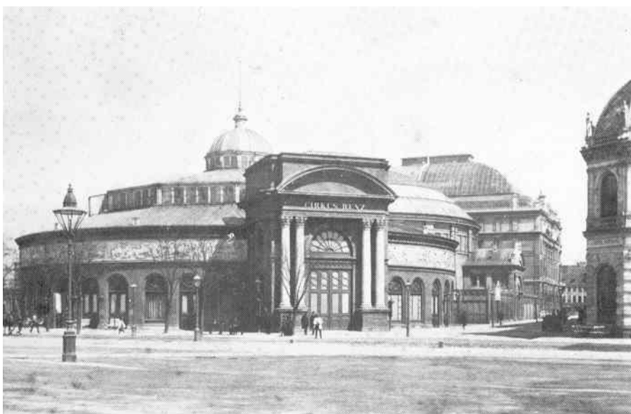
Dette foto af Cirkusbygningen er fra 1888, men den så ud på samme måde i 1890, dog bortset fra navnet Cirkus Renz

I Begyndelsen af September forlod Busch København med Ekstraskib til Stettin.