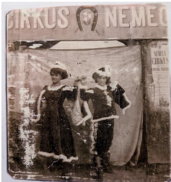
Det tjekkoslovakiske Cirkus Nemec