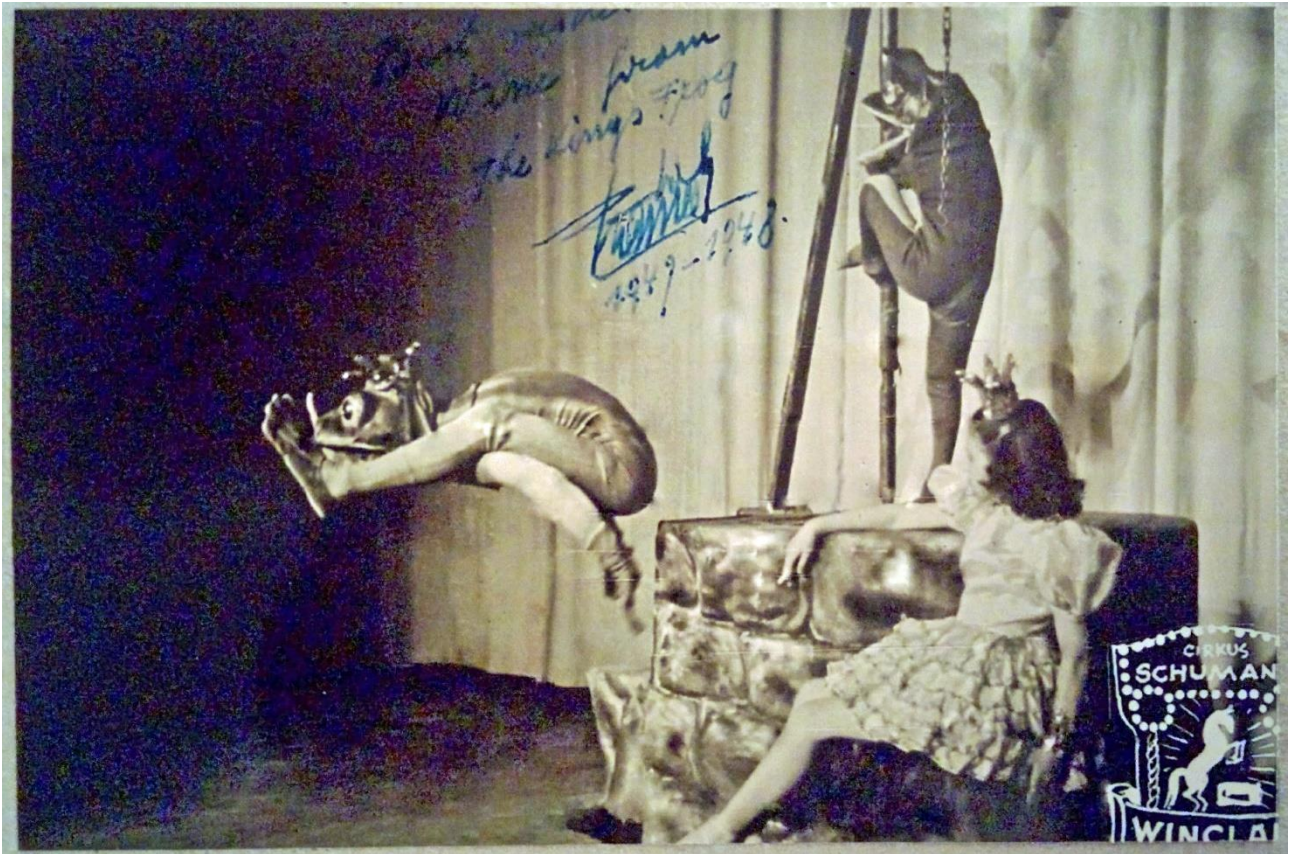
Fra Cirkus Schumann 1946