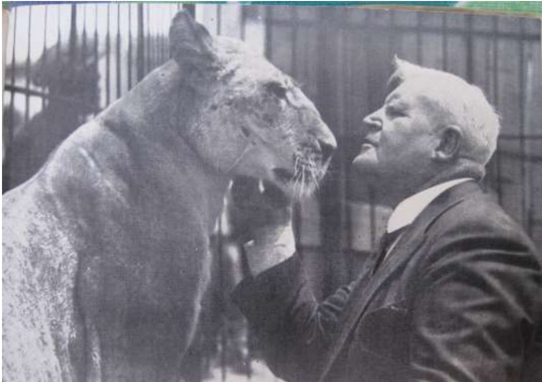
Tete-a-tete med en løve