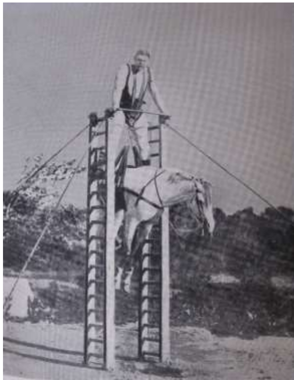
Sådan løfter man en hest!